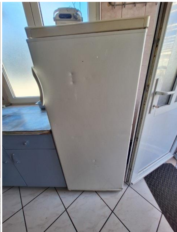
Slike 9 i 10 Hladnjak i ledenica