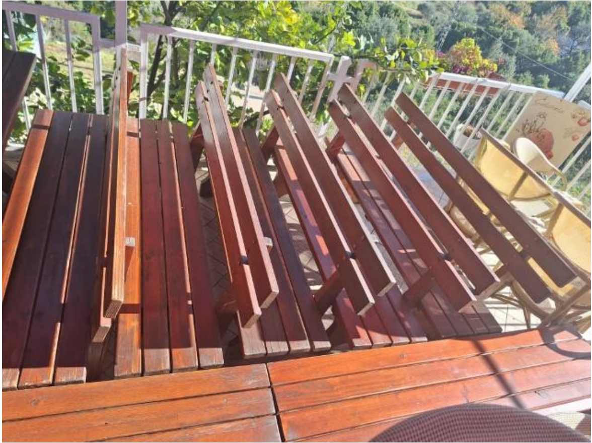
Slike 11 i 12 Sjedeća garnitura