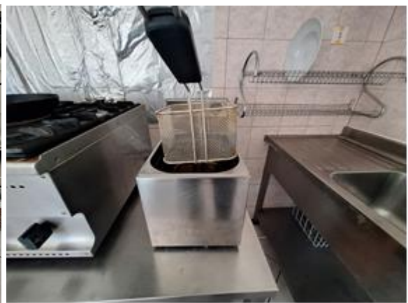
Slike 6 do 8 Plinski štednjak, roštilj i friteza