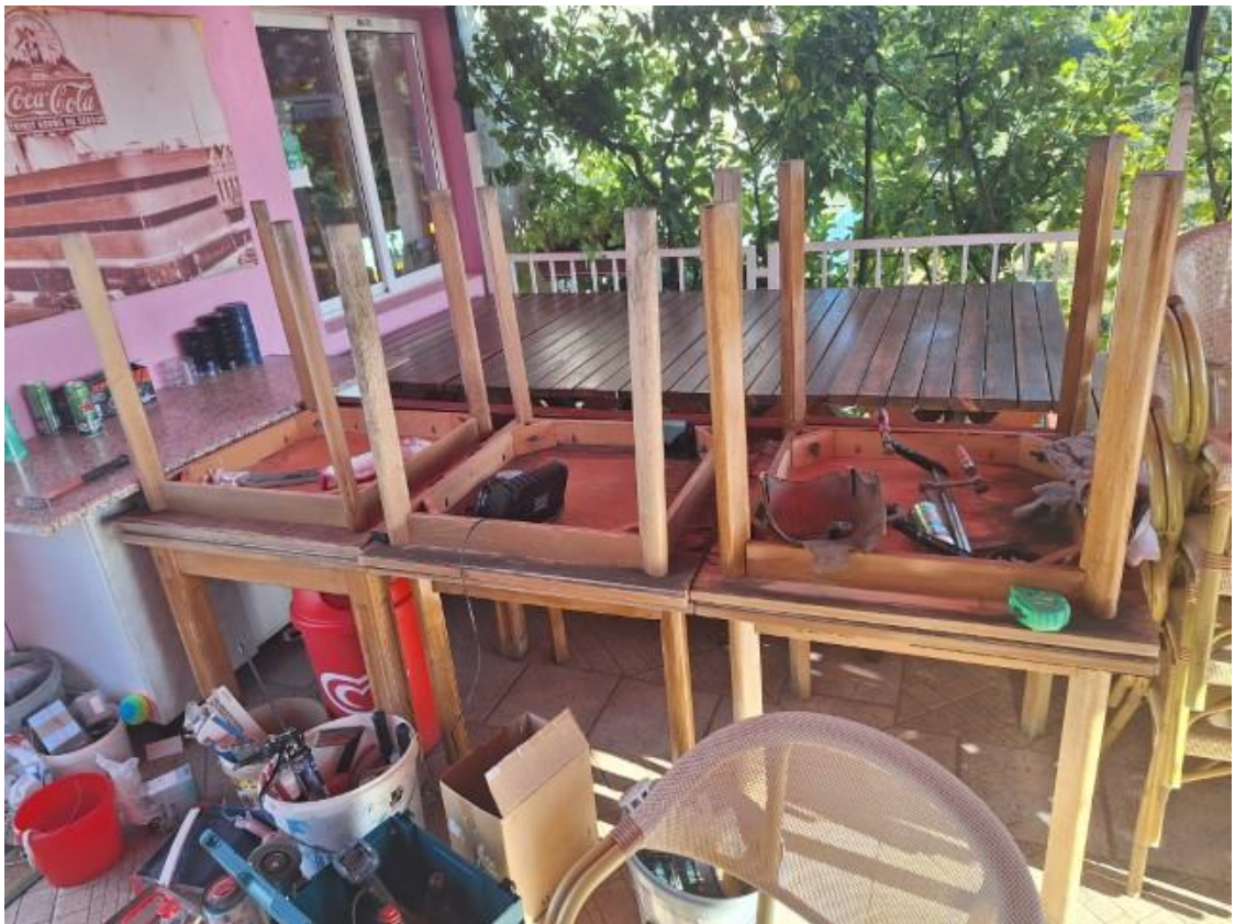
Slike 13 i 14 Stolovi i sjedalice sjedeće garniture