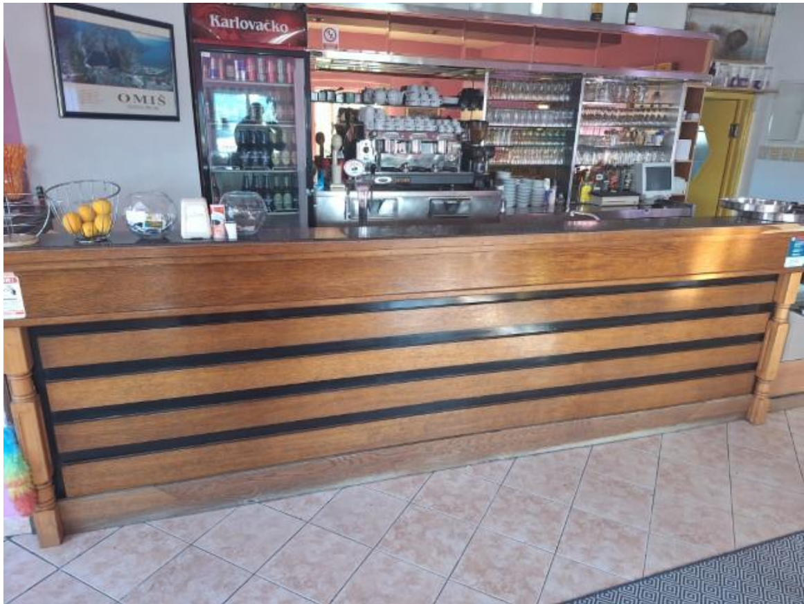
Slike 1 i 2 Retro pult i šank veliki